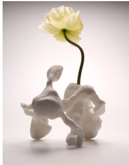
Marcel Wanders, Airborne Snotty Vase Sinusitis , 2001, Collectie Stedelijk Museum Amsterdam.

In het geval van de Airborne Snotty Vases was Wanders op zoek naar een object waarop hij een nieuwe 3D- printtechniek kon testen, iets wat niemand nog van dichtbij had gezien. Zo kwam hij op het snotje dat bij het niezen uit je neus vliegt. Van de snotjesvorm die hij sterk uitvergrootte, maakte hij 3D-prints, gaf er de functie van vaas aan en vernoemde ze naar verschillende virussen. De Airborne Snotty Vase is een typisch Wanders-object, met een vorm zó belangrijk dat je de functie haast vergeet. En wederom met het voor hem kenmerkende contrast tussen de uitvoering, in hypermodern geprint kunststof, en de betekenis van het snotje als iets heel menselijks, persoonlijks en gedetailleerds.