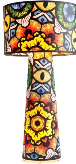
Marcel Wanders, Eye Shadow , 2013.