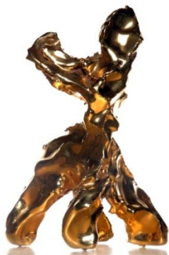
Marcel Wanders, One Minute Sculpture , 2004.