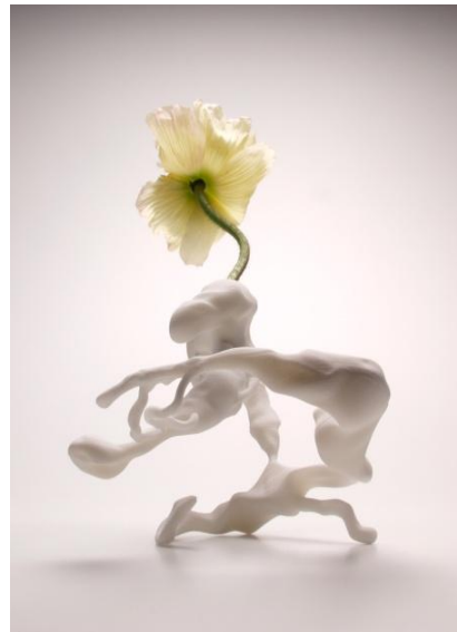
Marcel Wanders, Airborne Snotty Vase Coryza , 2001, Collectie Stedelijk Museum Amsterdam.